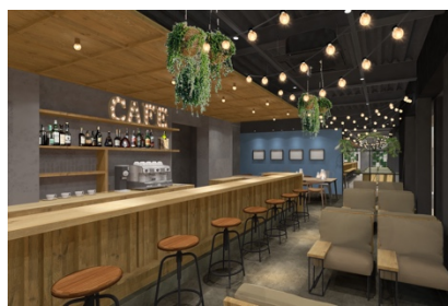
宿泊者専用カフェラウンジ