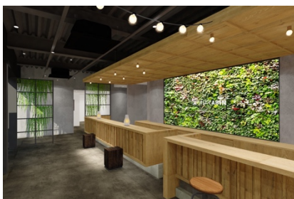
グリーンウォールのフロント